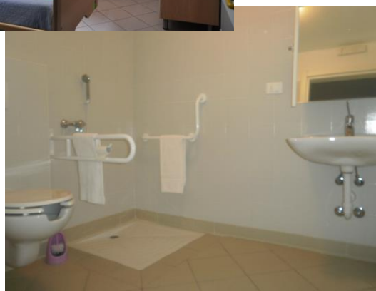
STANZA RISERVATA AI FAMILIARI